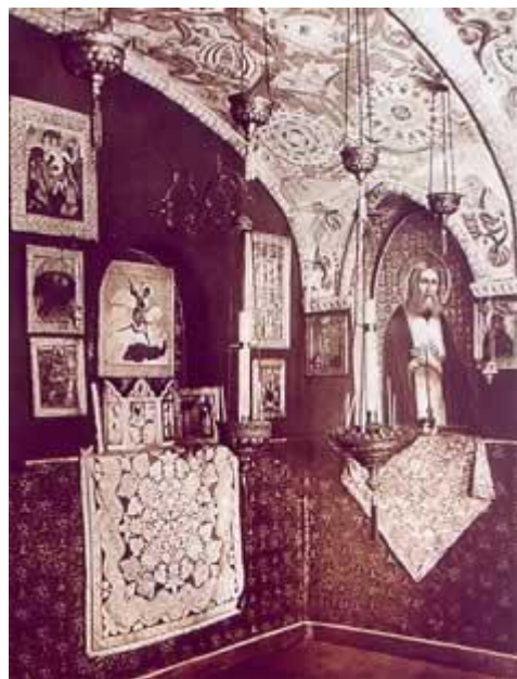
Северо-восточная часть пещерного храма преподобного Серафима Саровского в Царском Селе. Фото 1910-х годов

Временная церковь предшествовала Государеву Феодоровскому собору, основанному во имя родовой святых династии Романовых Феодоровской иконы Божией Матери с приделом во имя Небесного покровителя Цесаревича Алексея, митрополита Московского Алексия. Большой Государев Феодоровский собор освятили 20 августа 1912 года. В нижний пещерный храм собора была перенесена временная церковь во имя преподобного Серафима Саровского, освященная 27 ноября 1912 года. Великая Княгиня Елизавета Федоровна, прибывшая из Москвы ко дню освящения пещерного храма, привезла святыню — полумантию преподобного Серафима. Пещерный храм был местом молитв Царской