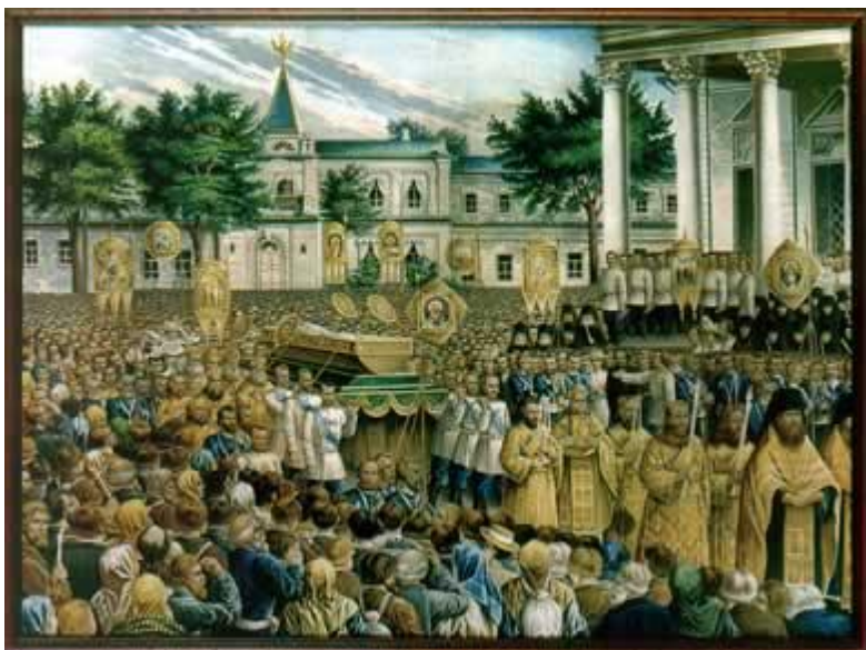
Крестный ход со святыми мощами преподобного Серафима в Саровском монастыре 19 июля 1903 года. 1903 год. Хромолитография. Мастерская Серафимо-Дивеевского монастыря

Тысячи людей в июльские дни 1903 года, дни прославления преподобного Серафима, собрались в Московском Кремле, заполнив не только Соборную площадь, но и Царскую площадь около колокольни Ивана Великого, а также пространство у Чудова монастыря, располагавшегося недалеко от Спасских ворот, через которые проходили многочисленные богомольцы. В Успенском соборе рядом с иконой новопрославленного Святого в особом драгоценном ковчеге для поклонения была помещена малая монашеская полумантия преподобного Серафима, доставленная из домового церкви московского генерал-губернатора Великого Князя Сергея Александровича (дяди Императора Николая II). Это была та полумантия, от которой получила исцеление дочь Императора Александра II Великая Княжна Мария Александровна и, которая сохранялась теперь у сына Императора Александра II, Великого Князя Сергея Александровича.