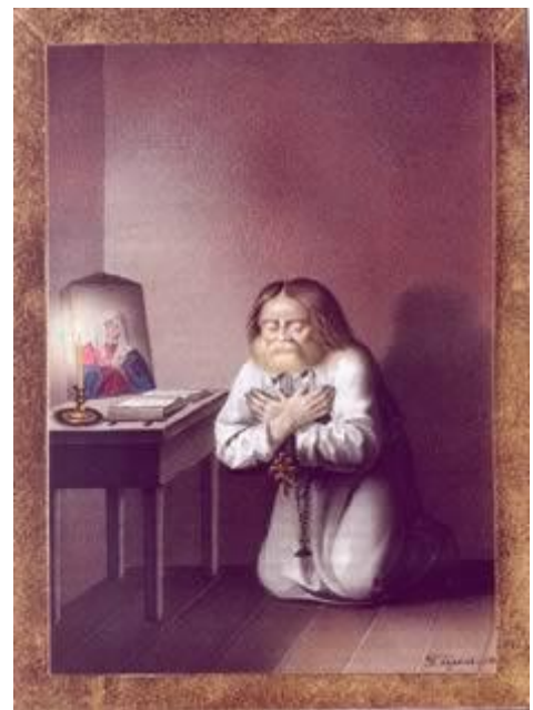
Праведная кончина старца Серафима. 1840-е годы. Акварель П. Ф. Борель, Санкт-Петербург. Российская государственная библиотека, Москва

К 1903 году, после написания архимандритом Серафимом (Чичаговым) и представленной Царю Николаю II «Летописи Серафимо-Дивеевского монастыря», стала очевидной необходимость церковного прославления всенародно почитаемого и любимого