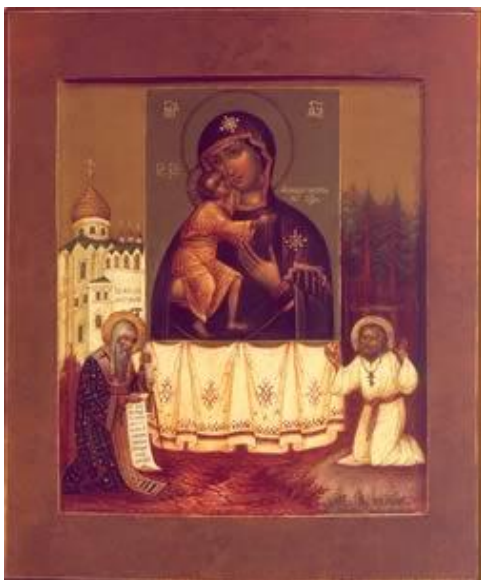
Преподобный Серафим Саровский изображен вместе с Небесным покровителем Цесаревича Алексея митрополитом Московским Алексием в молении родовой святыне Дома Романовых Феодоровской иконе Богородицы.