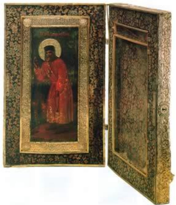
Складень-ларец для реликвий святого Серафима Саровского. Около 1903 года, Москва. Государственный Эрмитаж, Санкт Петербург

(Государственный Эрмитаж) и принадлежавший Царской Семье. На левой створе складня — живописное изображение благословляющего преподобного Серафима в рост, в белом балахоне, чуть согбенного, с большим медным крестом — материнским благословением. В такой иконографии Преподобного часто изображали в XIX в., в том числе на полотнах живописной мастерской Серафимо-Дивеевского монастыря. В ковчеге правой створы