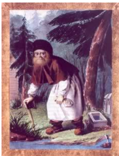
Старец Серафим в Ближней пустыньке. 1840-е годы. Акварель П. Ф. Борель, Санкт-Петербург. Российская государственная библиотека, Москва

Старец Серафим был известен Царскому Дому Романовых задолго до канонизации Преподобного в 1903 году. По бытовавшей в народе легенде, с преподобным Серафимом встречался Император Александр I. Весть о Саровском подвижнике, обладавшем глубоким смирением, дарами пророчества и прозорливости, могла дойти до Царя от знатных особ русских фамилий посещавших Преподобного.