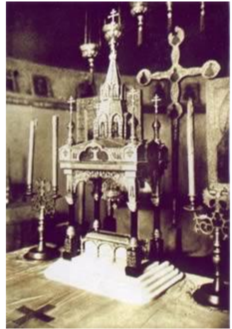
Дарохранительница из пещерного храма преподобного Серафима Саровского в Царском Селе.